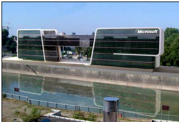
Teleconnect Standort Köln

Gegründet 1998, positioniert sich T&S als ganzheitlicher ICT-Lösungsanbieter sowie Service- und Beratungsspezialist mit langjähriger Erfahrung in der IT und Telekommunikation.