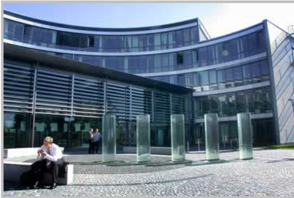
Teleconnect Standort München / Unterschleißheim